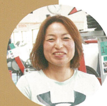
元気クラブ歴：約2年

元々は、違うジムに通っていましたが、マシンが揃っているということを聞いて元気クラブへ。“子育てや仕事に追われたるんでいた体を引き締めたい”と思って頑張っているとトレーナーさんが褒めてくれ、それが嬉しくて、モチベーションに繋がっていきました。今は次の目標に向けて頑張っています！